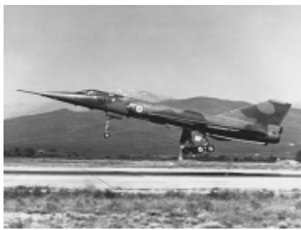
Стратегический бомбардировщик "Мираж IVA"

Организационно стратегические ядерные силы включают стратегические ракетные