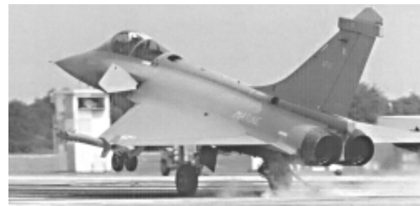
Корабельный самолет "Рафаль-М"

авианосца до 36000 т, на нем может базироваться до 40 летательных аппаратов. Уже запланирована замена палубных самолетов «Супер Этандар» авианосца «Шарль де Голль» на новые «Рафаль-М» (максимальная скорость 2М, дальность полета 3335 км). В 2007-2008 гг. эти самолеты могут быть оснащены модернизированными ракетами Air-Sol-Moyenne-Portee-Amelioré (ASMP-A, ASMP-Plus) с дальностью стрельбы до 500 км, разработку которых ведут фирмы Aerospatiale и Matra . В соответствии с требованиями Министерства обороны ракета должна подходить к цели на малой высоте и обладать устойчивостью к