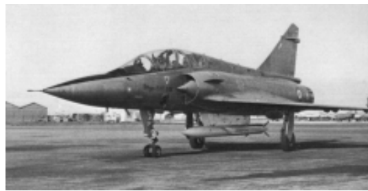
Истребитель-бомбардировщик "Мираж-2000N" с ракетой ASMP

силы наземного базирования и морские стратегические силы. К концу 1970-х годов СЯС состояли из 36 средних бомбардировщиков «Мираж IVА» оснащенных атомными бомбами мощностью до 70 Кт, 18 баллистических ракет средней дальности наземного базирования и пяти ПЛАРБ с 16 БРПЛ на каждой. Право принятия решения, на применение стратегических ядерных сил принадлежит президенту страны или лицу, заменяющему его. Главным содержанием военной доктрины Франции по-прежнему остается стратегия «сдерживания и устрашения», основанная на наличии у государства собственного оружия.