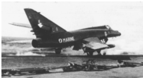
Корабельный самолет "Супер Этандар"